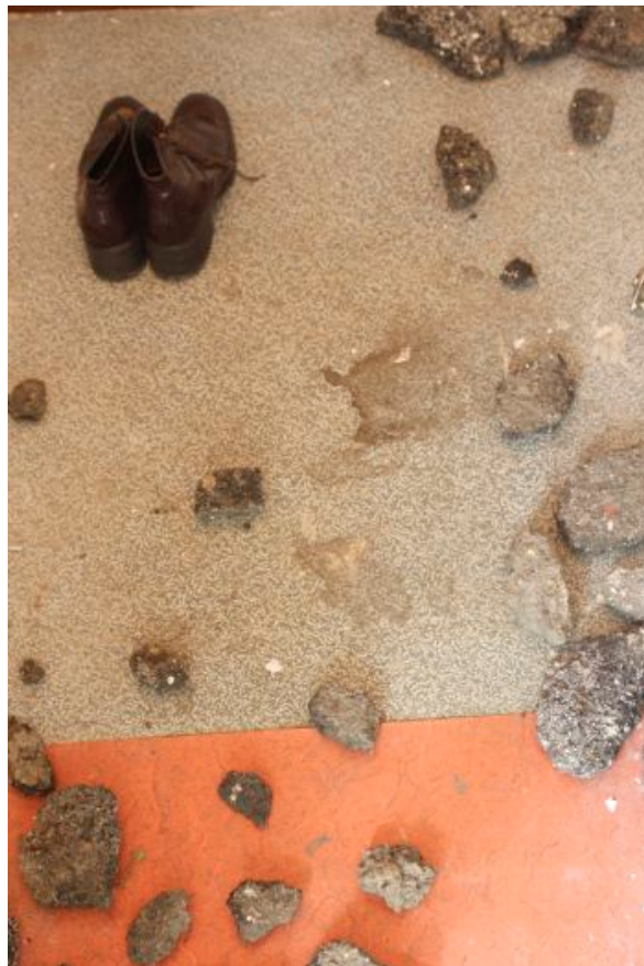
"City", installazione, 200x100x90x100cm, 2014