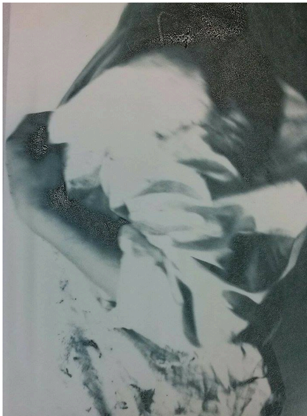
"Vicino", digigraphia sulla carta velina, 75x100cm, 2015