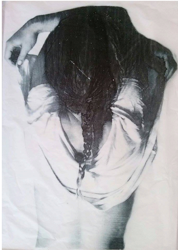
"ora?", digigraphia sulla carta velina, 70x100cm, 2015

Opere appeso bagno. Un luogo che è umido. Un luogo dove il contatto con ilacqua è inevitabile. Ma se il lavoro è influenzata da troppa umidità o esposto dripping gocce d'acqua, sono danneggiati. Si ricorda la fragilità del (instabile), che è presente in tutte le aree dentro di noi, ma vogliamo nascondere dagli altri. a volte noi resta che esporre con sconsideratezza / coraggio.