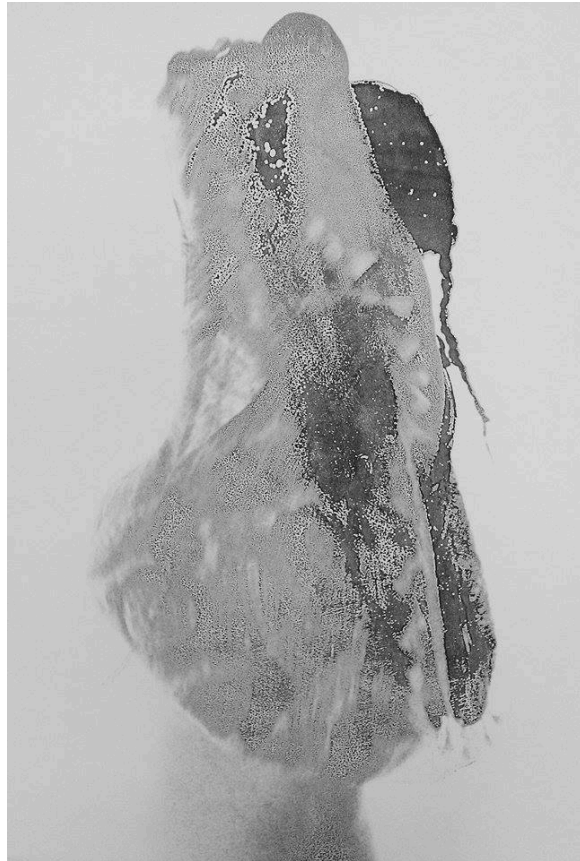
"il vento", digigraphia sulla carta velina, 60x100cm, 2015