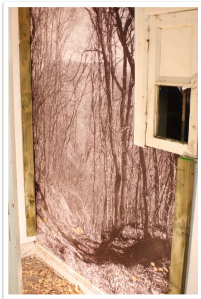
"Foresta", installazione, 150x120x120xm,2013

Esposizione Ho creato due installazioni, l'idea di base era quello di "creare un buco nel muro." Imparare a vivere e Venezia sono i giorni in cui mi spinge la casa per creare un labirinto di pareti e appartamenti bianchi. Sarà poi izlausties attraverso e respirare aria fresca più spazio. Uno di questi giorni, ho avuto l'idea di rendere l'installazione a parete che sarebbe "una finestra in una posizione diversa." Venite la graffia e di Animale. Foto che formavano "buco" è stato ravnivano. Installazione "City", ha ritratto pezzi le strade di Parigi con una ragazza. Le ragazze vestono "è venuto" fuori le fotografie, le scarpe sono state lasciate da questa parte, le fette di strada asfalto a camera si trovano sulla terra. Tuttavia, l'installazione secondo "Foresta" è stato raffigurato nella foresta del nord Italia. A terra è stata prevista segatura che è entrato il sentiero nel bosco.